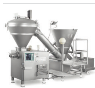
Das System füllt großstückige Ware wie komplette Muskeln produktschonend ab.

Das Total Vacuum System TVS149 ergänzt die Füllmaschinen-Serie HPE von Vemag Maschinenbau aus Verden. Mit dem Vakuumtrichter ausgerüstete Maschinen arbeiten im kontinuierlichen Betrieb, da im Trichter stets das benötigte Vakuum anliegt. So lassen sich Schinkenprodukte optimal fördern und portionieren. Zwei getrennt gesteuerte Vakuumanlagen sorgen dabei für den richtigen Zug.