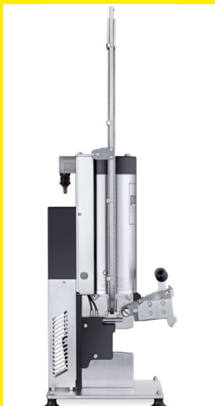
EZ 8080 mit optionalem Messer