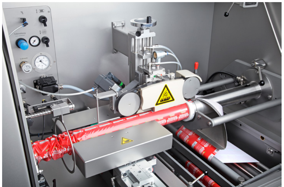
Heißsiegelstation des TSCA für zuverlässige Siegelung

Das komplette System aus Clipmaschine, Clip und Schlaufen aus einer Hand sorgt für eine effiziente und störungsfreie Produktion. Original Clip von Poly-clip System garantieren höchste Qualität. Die Herstellung unterliegt strengsten Qualitätsprüfungen. Zertifiziert nach ISO 22000 und ISO 9001 sind sie passgenau auf den Produktionsprozess abgestimmt. Die Poly-clip SAFE-COAT Technologie sichert durch eine lebensmittelechte Sicherheitsbeschichtung, überprüft durch das SGS INSTITUT FRESENIUS, eine störungsfreie Produktion und ggf. eine zweifelsfreie Produkthaftung. Poly-clip System ist der weltweit führende Anbieter von Clip-System-Lösungen.