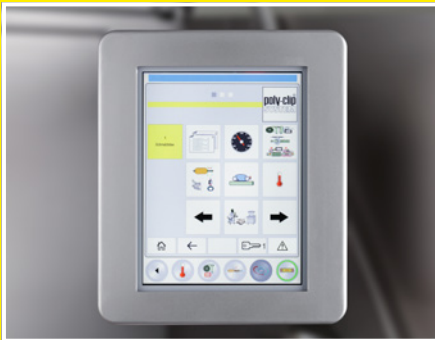
Das Touch-Panel des TSCA: einfach und übersichtlich