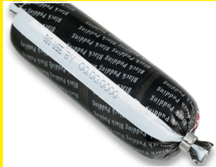
Produktkennzeichnung durch direkten Druck auf die Folie